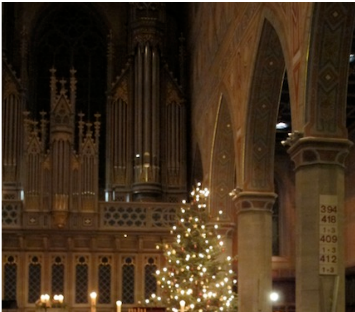
Heilig Abend 2014 in der St. Laurenzen Kirche in St. Gallen

Ich legte mich für eine kurze Zeit ins Gras. Wenige Minuten später wurde ich an das Todesbett meines Vaters geholt.